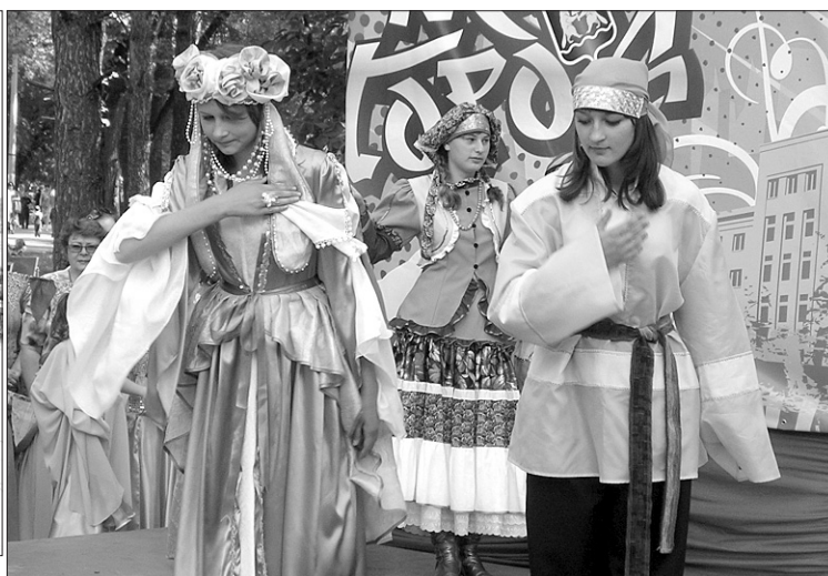
Праздничный концерт, посвящённый Дню города.